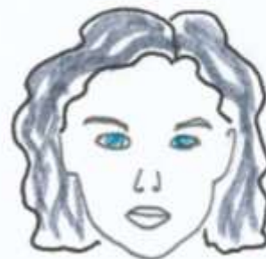
Luz el pelo gris, ondulado, largo los ojos azules