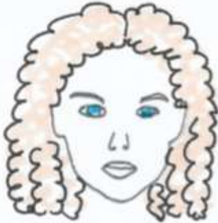
Eva es pelirroja, el pelo rizado, largo los ojos azules